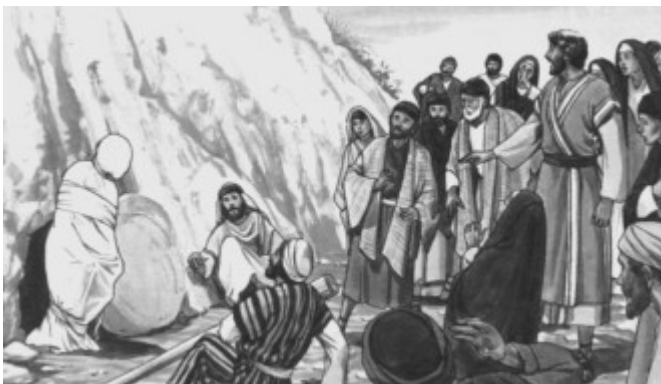
İsa 4 günlük ölüyü diriltirdi. Ondan sonra ölü adam insanların arasına girdi

Йух. 11: 39-44'те шьойле язъйор: 'ЬОленин къзкардеши Марта, "Раб, о артък кокушмуштур, ьолели дьорт гюн олду" деди. Иса она, "Бен сана, 'иман едерсен Танр'нън йуджелиини гьореджексин' демедим ми?" деди. Сонра йюксек сесле, "Лазар, дъшаръ чък!" дийе баърдъ. ЪОлю, еллери аякларъ саргъларла балъ, йюзю безле сарълмъш