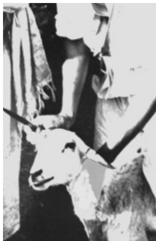
Бу койун сенин истеклерине каршзлзк веребилир ми?

Бу насъл мъ олду? Аллах кендини бириджик Олунда, яни Иса Месих'те гьостерди. Ону йерйюзюне йолладъ, сенин яшам'ън олсун дийе. Сенин ве бютюн инсанлар'ън гюнахлар'ънъ онун юзерине койду ве изин верди, хачта Ыолсюн. ЫОйлеликле Ону сенин ичин курбан етти. Бизе шимди дюшюйор, саде Аллах'ън вермиш олдуу курбан'ънъ кабул еделим. Деил биз Ондан башка бирханги курбан верелим Аллага. Аджаба хангисинин съюзю гечер: Аллах'ън мъ йокса инсан'ън мъ? Бугюн Аллах дедийсе, "Сизден курбан истемийорум. Бен сизе курбан вердим, Ону кабул един.", о заман О му бизи сеслесин, йокса биз ми Ону сеслейелим? Чюнкю хер заман истийоруз бизи сеслесинлер, хич истемийоруз биз сеслейелим. Онун