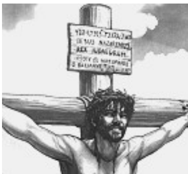
İsa'nın haçtaki ölümü bize yaşam verdi ve şeytanın elinden serbest etti.

"Онда рух хюкюметлери ве оторителери йенди, онларъ сойунтурду, онларъ херкесин ьонюнде резил етти." (Колоселилер 2:15)