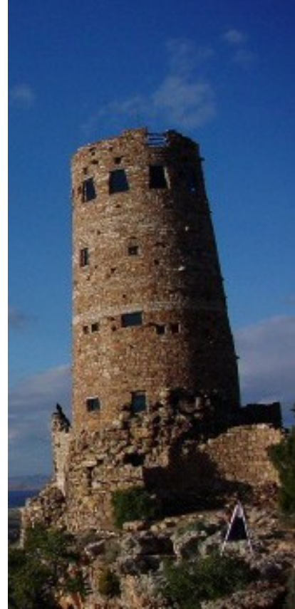
'Migdal Eder' bunun gibi bir kule idi