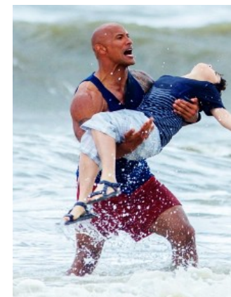
Куртаръджъ бизе ярдъм едийор

Иса'нън адъ кенди дилинде ъозел бир анламъ вар: "Аллах куртарыйор". Демек бу адън чок буюк ъонемии вар: Иса не ичин дюня гелди ве Оун хаятъ не ъонем ташыйор, бу аддан белли олуйор: Иса бизи куртармак ичин гелди. Пейгамберлер ону япамаз, бизи куртарамазлар. Онлар янлъз бирер уяръджъдър. Йол кенаръндаки табелалар гиби: онлар коркунчлуу гьостерийорлар, шофьорлери уярыйорлар. Ама хер шофьор сонра кендиси карар верийор, ве хата яптъ мъ, арабасънъ бир йере чарптъ мъ, она ким ярдъм едеджек? Табела ону о дурумдан куртарамаз. Ама линейка ве доктор гелиндже шофьору куртарабилерлер. Иште, Иса'нън яптъ будур. Демек, Иса Месих бир куртаръджъдър; хатта тек куртаръджъдър. Она пейгамбер демейелим.