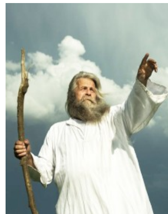
Пейгамбер садедже уярыйор