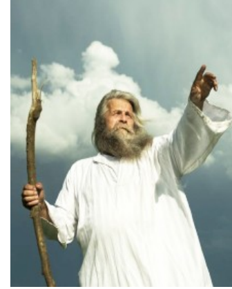
Peygamber sadece uyarıyor