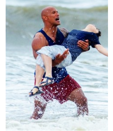
Kurtarıcı bize yardım ediyor