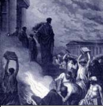
Efes'te büyücüler İsa'yı kabul edip kitaplarını yaktilar

Muhammed kendini son peygamber olarak ilan etti. Onun için bekliyoruz, güç, ahlak ve öğretilş bakımından bütün peygamberlerden daha üstün olsun. Ama onu İsa Mesih'le karşılaştırdığımızda büyük bir fark görüyoruz: İsa'nın yanında Muhammed çok daha zayıf bir kişidir.