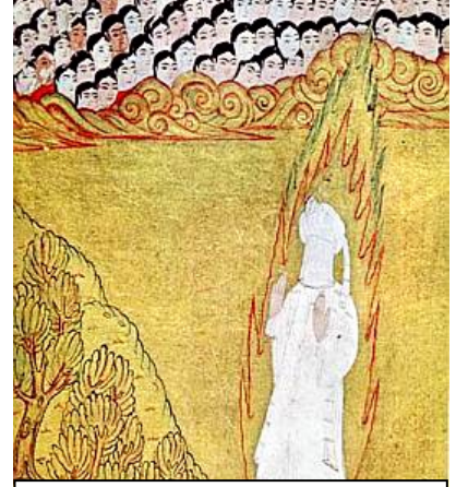
Muhammed'e Hira mağarasında görünen kimdi?

Kutsal Kitap'taki tanrının tek bir özel adı var: YAHVE. Her Yahudi, her Hristiyan onun adını biliyor ve o adla ona saygı gösteriyor. Ama Muhammed, bütün Araplar gibi, onun adını bilmezdi. Arapların Al-Lah tanrısının kendini eski peygamberlere tanıtan Yahve'nin olduğunu sandı. Ama bu doğru değildir. Bütün Kuran'da bir kere olsun Yahve adı geçmiyor. Muhammed'e görünen ruhsal varlık gerçek Tanrının meleği değildi, yoksa onun adını anacaktı, o adla konuşacaktı.