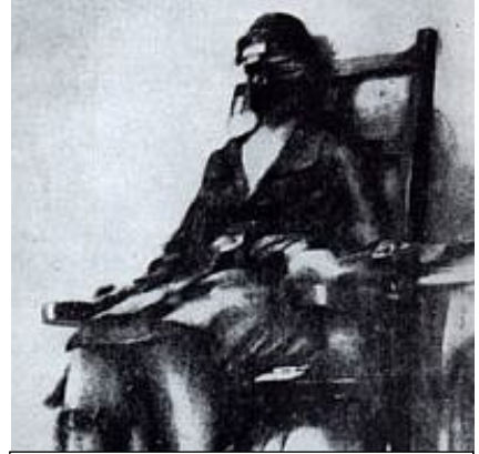
Etel Rosenberg – 1953 yılında casusluk için idam edilmiş bir amerikalı kadın

Ama eski peygamberlerden her ne kadar günaha düşenler olduysa da, hiç kimse Muhammed'in yaptığını yapmadı: hiç kimse Allahın sözlerinin arasına Şeytanın sözlerini katmadı. Hepsi Şeytan tarafından aldandı diyebiliriz, ama hiç kimse Şeytanın sesini Allahın sesiyle karıştıracak kadar düşmedi. Peygamber de olsa, her insan hata yapacak kadar zayıftır, her türlü günaha düşebilir, ve arkasından ondan tövbe edebilir. Ama Şeytanın sesi ile Allahın sesine fark edemeyen kişi, peygamber olamaz, çünkü Şeytana bu biçimde kulak verip aldanmakla peygamberliğinin temelini bozmuş oluyor.