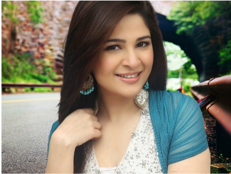
Ayeşa Omar, Pakistan'ın en popüler modeli ve film aktrisi İsmailidir