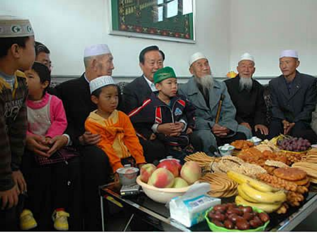
Şeker Bayramını kutlayan bir Hui aile