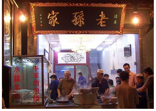
Ji-an kasabasında bir müslüman restoran

Huiler eskiden beri çiftçilik ve hayvancılıkla uğraşıp bugüne kadar çoğunlukla köylerde yaşıyorlar. Gıda üretiminde çok başarılı oldular. Örneğin, helal (yani domuz eti kullanmayan) yemekleri satan makarna restoranları bütün Çin'de meşhur oldu. Son yıllarda Doğu Türkistan'da madencilik ( minalar ) yaygınlaşmaya başladı; birçok Hui de o işte çalışıyorlar.