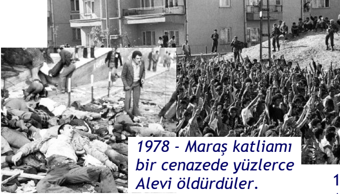
1978 - Maraş katliamı bir cenazede yüzlerce Alevi öldürdüler.

Sunni müslümanlar Alevileri hor görürler, müslüman olarak kabul etmezler. Onları murdar sayıp haklarında her türlü kötü laf söylerler. Türkiye'de o Sunni-Alevi düşmanlığı o kadar büyük oldu ki, Sunniler tarih boyunca binlerce Alevi öldürdüler.