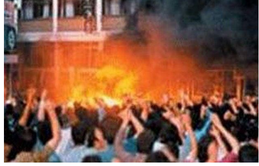
1993 - Sivas katliamı - bir hotelde toplanan Alevi yazarları diri diri yaktılar: 37 ölü.

Türkiye aslında birçok halkların ve kültürlerin yanyana yaşadığı bir devlettir. Buna karşın, 70 seneden beri sanki tek bir halk varmış gibi gösterilmeye çalışılıyor. Şimdi ise, hükümet bu politikadan yavaş yavaş uzaklaşıyor. Büyük kasabalarda Aleviler merkezler açtı. Okumuş Aleviler kendi kültürü, tarihi ve adetleri hakkında açıkça konuşmaya başladı.