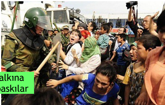
Uygur halkına yapılan baskılar