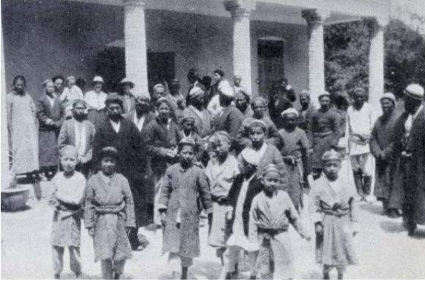
1920'lerde Kaşgar'daki imanlılar

kestiler, kimisi hapiste öldü. Kadınları ve çocukları müslüman beylerin haremlerine kapatıp köle ettiler. Ancak birkaç çocuk ve kadın hayatta kaldı. Onlar da sonra ikinci dünya savaşı ve komünist hükümetinin baskılarına kaldılar. Uygur kilisesinin sonu böyle oldu.