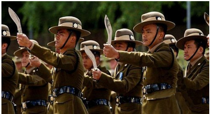
Gurkalar - Nepal'ın bu özel birliği, bütün dünyada en korkusuz askerler sayılıyor