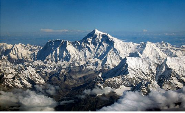
Dünyanın en yüksek dağı Mount Everest (8848 m)