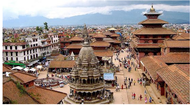
Başkent Katmandu (nüfusu: 3 milyon)

Bugün dua etmek için yukarıya biniyoruz... dünyanın çatısına ! Dünyanın en yüksek on dağların sekizi Nepal'da bulunuyor. Hindistan ile Çin arasında bulunan bu ülke, 2006'ya kadar dünyanın son hinduist krallığı idi; ama sonra demokratik bir devlet oldu. O zamana kadar hinduizm devlet dini idi, ama şimdi bütün dinler devletin önünde eşittir.