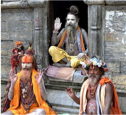
Sadular hinduist kutsal adamlar

Bugün dua etmek için yukarıya biniyoruz... dünyanın çatısına ! Dünyanın en yüksek on dağların sekizi Nepal'da bulunuyor. Hindistan ile Çin arasında bulunan bu ülke, 2006'ya kadar dünyanın son hinduist krallığı idi; ama sonra demokratik bir devlet oldu. O zamana kadar hinduizm devlet dini idi, ama şimdi bütün dinler devletin önünde eşittir.