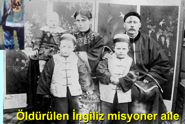
Öldürülen İngiliz misyoner aile