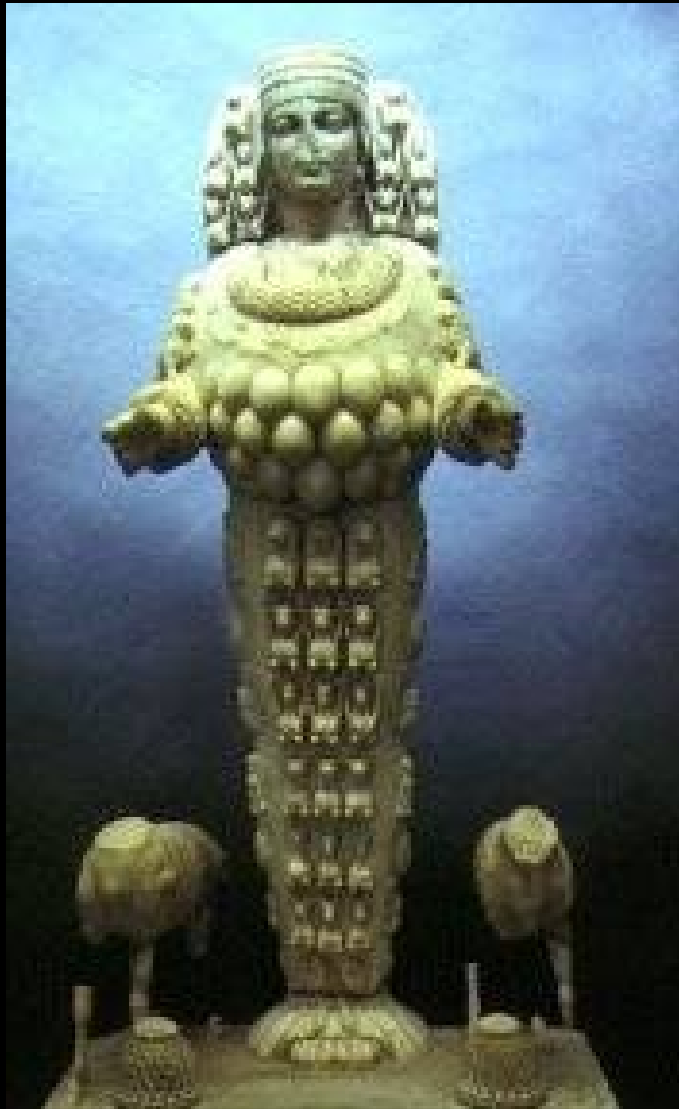
Ефес касабасында Артемис пугу. (Апо 19)