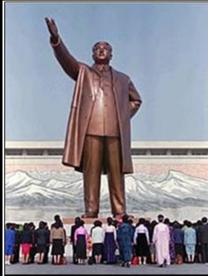
Атеист Северна Кореа'да диктатор Ким Ил Сунг'ун хейкели – хер йерде о хейкеллер вар, херкес де лазъм онлара сайгъ гьостерсин.