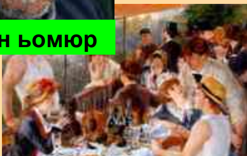
йемек ичмек ейлендже