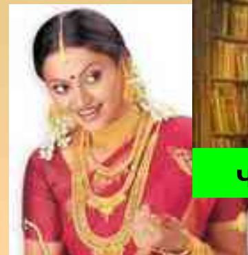
чок алтън, дююнлер