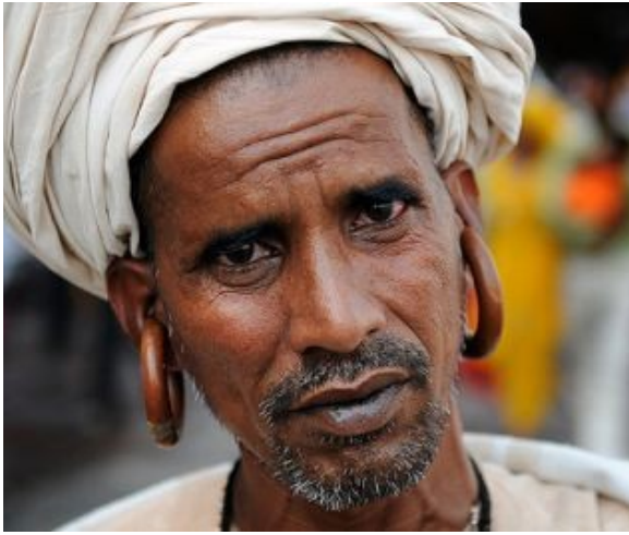
erkekler için kocaman küpeler

BELİRTİ / NİŞAN ... başka ne olabilirdi ???