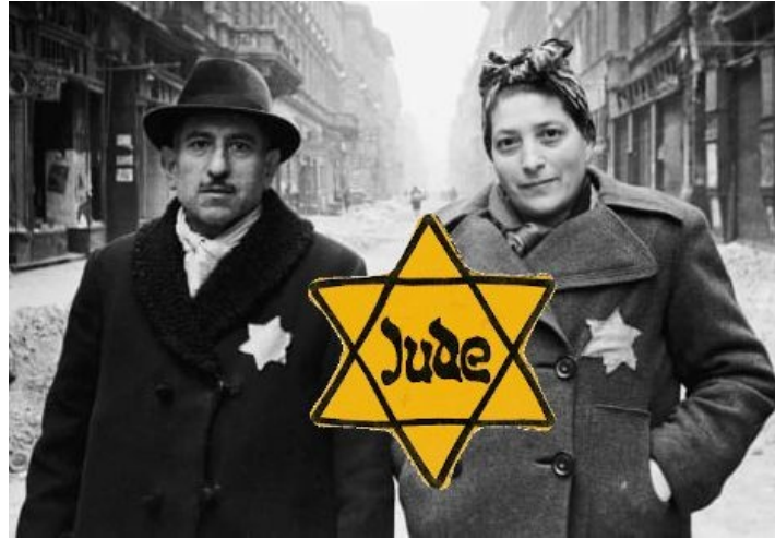
sarı Yahudi yıldızı Nazi zamanında ve müslüman İspanya'da