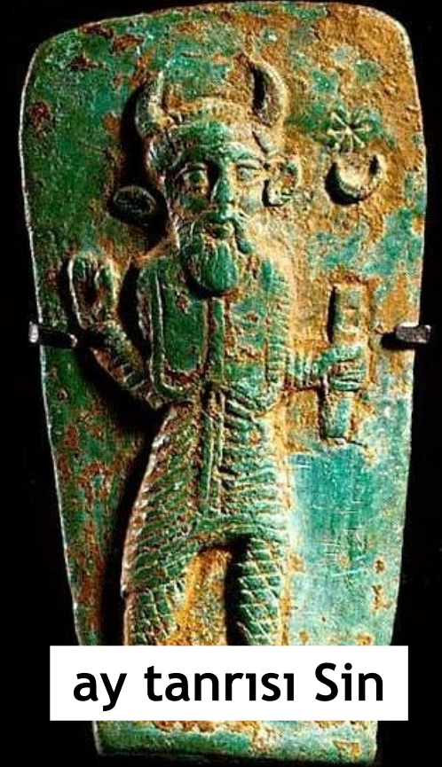
ay tanrısı Sin