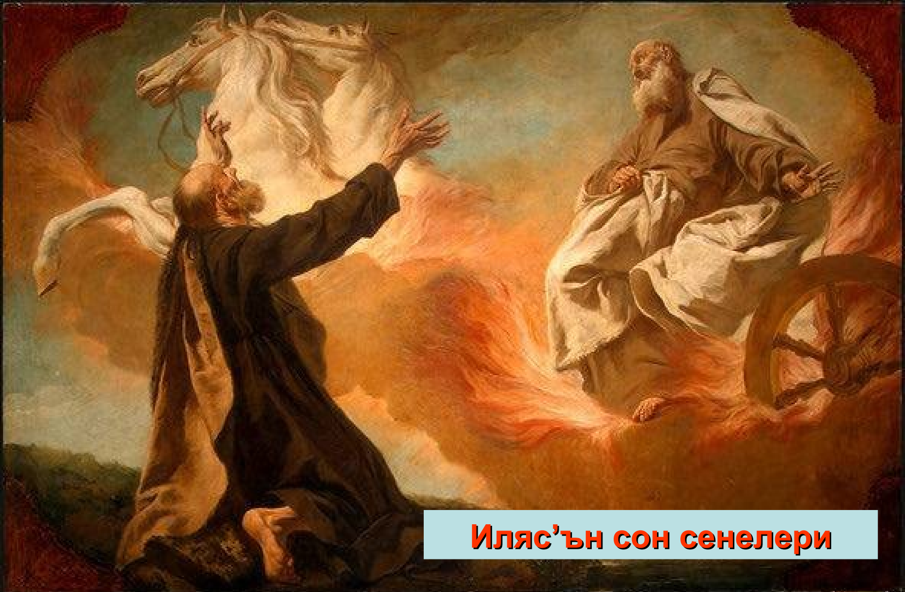
Иляс'ън сон сенелери