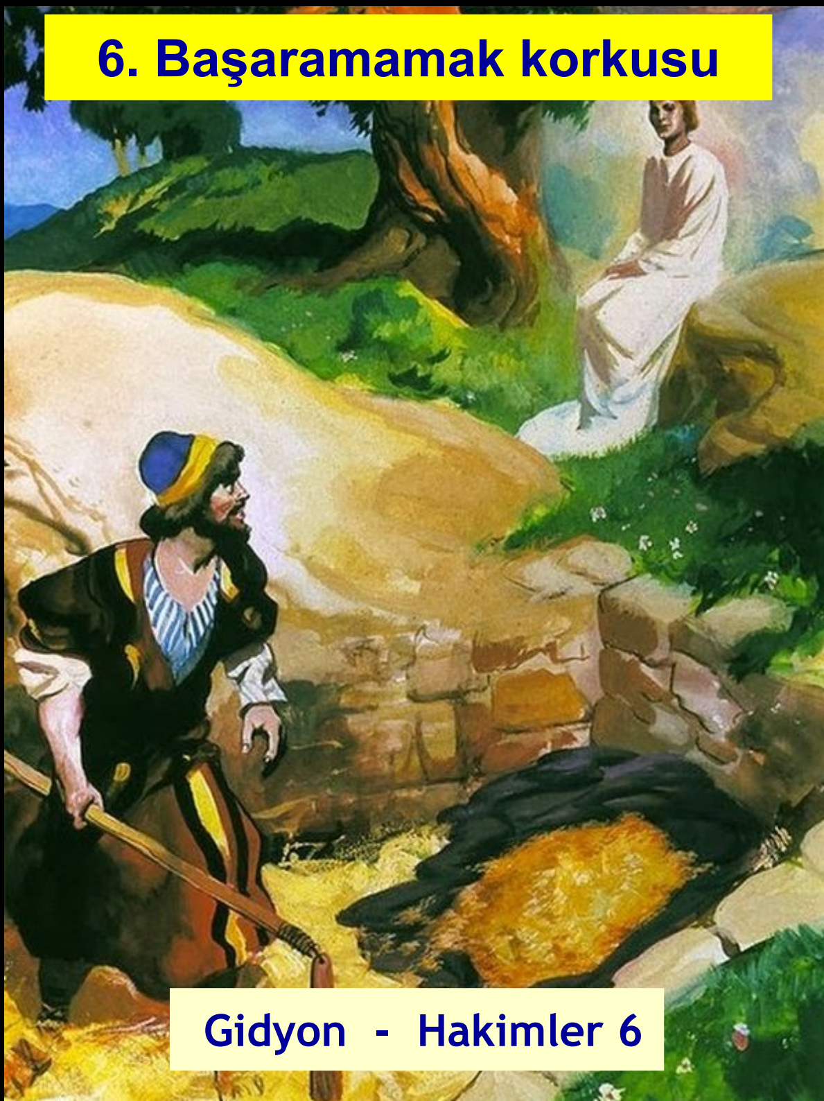
Gidyon - Hakimler 6

11 RAB'bin meleği gelip Aviezerli Yoaş'ın Ofra Kenti'ndeki yabancı fıstık ağacının altında oturdu. Yoaş'ın oğlu Gidyon, buğdayı Midyanlılar'dan kurtarmak için üzüm sıkma çukurunda dövüyordu.