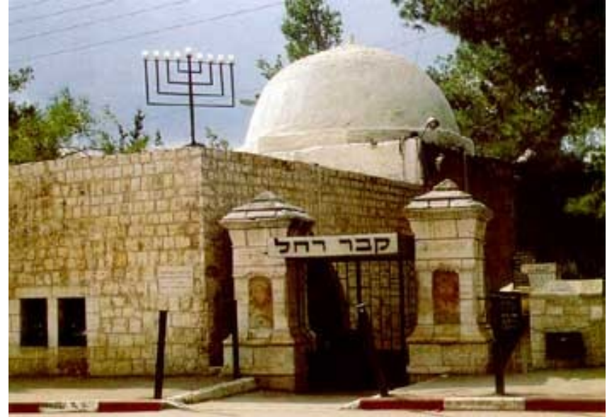
Rahel'in mezarı Beytlehem'de