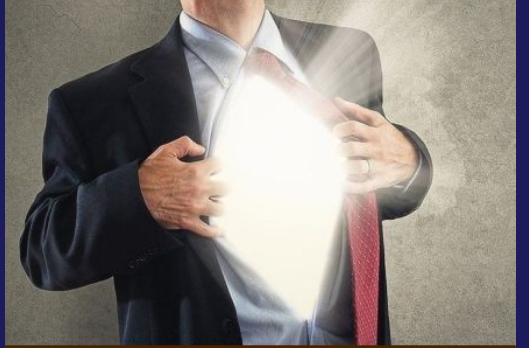
4. İmanlının Bedeni