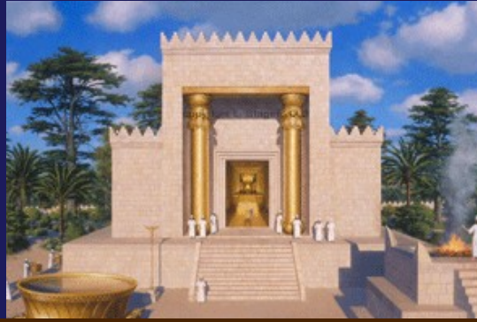
2. Taş Tapınağı (Süleyman, Zerubabel, Hirodes)