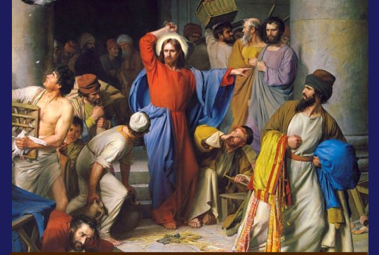
3. İsa'nın Bedeni