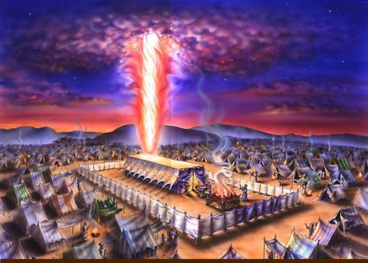
1. Tapınak Çadırı