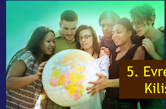
5. Evrensel Kilise